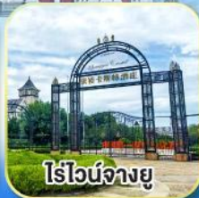
ไร่องานยู