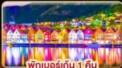
พักเบอร์เกน 1 คืน