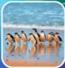
เพนกวินที่เกาะฟิลลิป