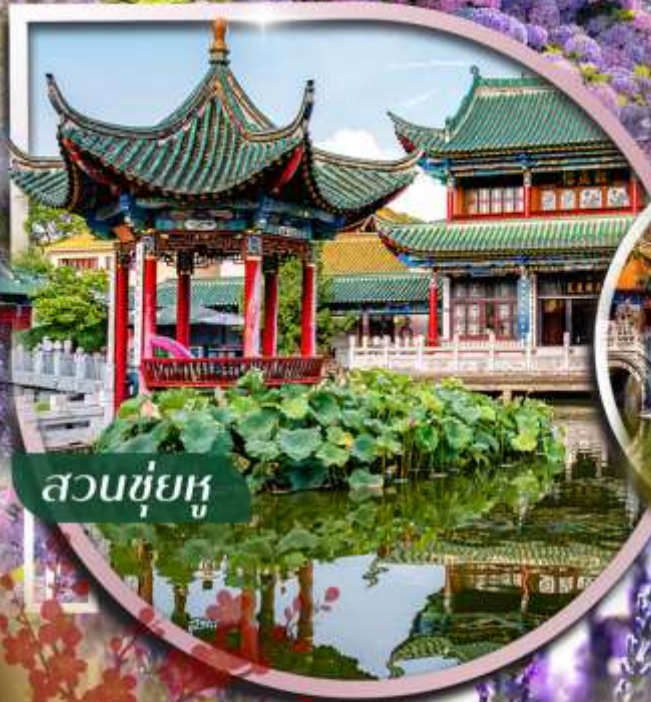
สวนชู่ยู่

ชม กิ่งดอกไม้บานสะพรั่ง ที่สวนลาวหยูเหอ และ สวนต้ากวน ตื่นตาไปกับสวนน้ำตกคุณหมิงอันอลังการ ใจกลางเมือง