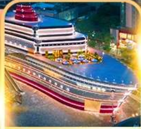
เรือ The LOUIS