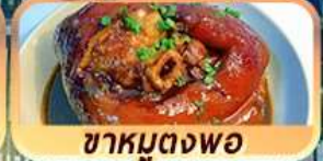
ชาหมูตงพอ