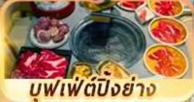
บุฟเฟ่ต์ปิ้งย่าง