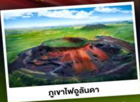
ภูเขาไฟอูลันดา

ท่องเที่ยวแดนแห่งทะเลทรายและทุ่งหญ้า ชมพระอาทิตย์ขึ้นทุ่งหญ้าออร์ดอส