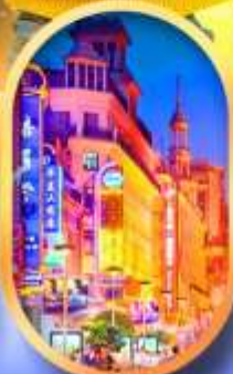
ถนนหนานกิง