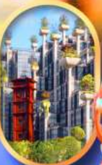
อาคาร 1,000 คัดไม้