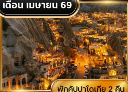
พักคัสปาดอกีย์ 2 คืน