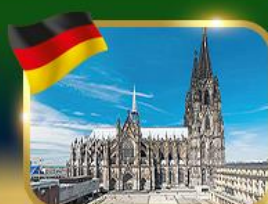
มหาวิหารแห่งเมืองโคโลญ