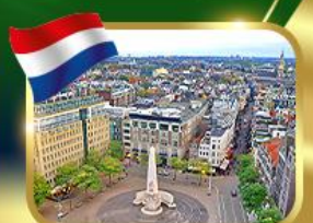
จัตุรัสดันสแควร์ อัมสเตอร์ดัม