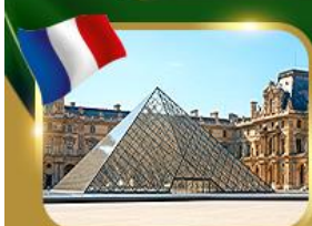
พีระมิดที่ลูฟวร์ ปารีส