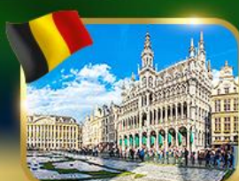
จัตุรัสกรองด์ ปลาซ บรัสเซลส์