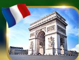
ประตูชัยฝรั่งเศส ปารีส