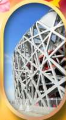
ผ่านชมสนามกีฬาโอลิมปิก