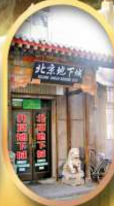
เมืองโบราณใต้ดิน