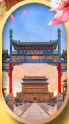
ถนนคนเดินเจียมเหมิน