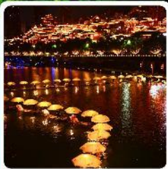
เมืองเซียนเอน