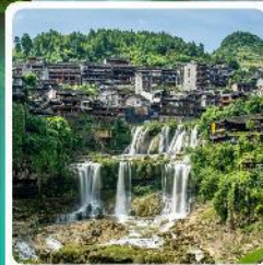
ฟูรงเจิน

• โฮเทล อูยกานเทียนเหมินซาน หุบเขาวงกต เมืองโบราณเซียนเอน หมู่บ้านโบราณฟูรงเจิน ภูเขาโรซาอู่จียโต อูยกานชื่อจ้อกวนด่านสิงโต