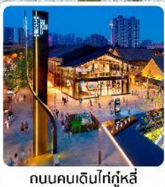
ถนนคนเดินไท่กุ๋หลี