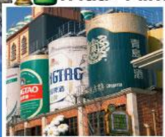
พิพิธภัณฑ์โรงเบียร์ชิงเต่า