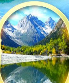
อุทยานปี้ฝิงโกว