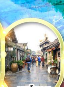
ถนนโบราณ ชอยกั้วจิงชอยแคบ