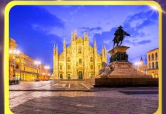
มหาวิหารคูโอโม