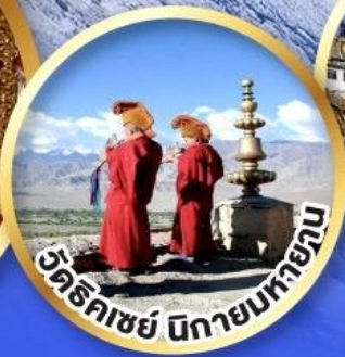
วัดธิกะชัย นิกายมหายาน