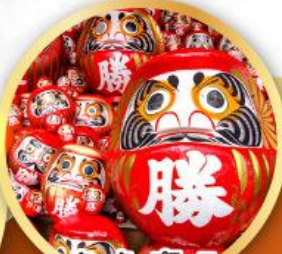
วัดคิตสึโอจิ (วัดดาร์มะ)

ชมความงามของกำแพงหิมะ เส้นทางสายอัลไพน์ ทากายามา (JAPAN ALPS SNOW WALL)