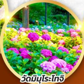
วัดมิมุโระโทจิ