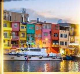
ท่าเรือประมงเจิ้งปิง