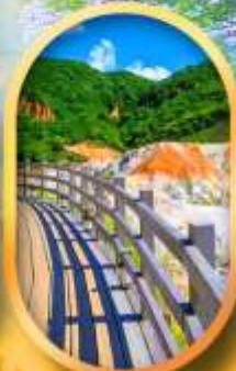
โนโบริเบทสึ