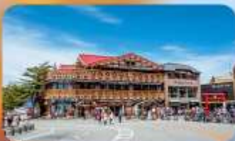
ภูเขาไฟฟูจิ ชั้นที่ 5