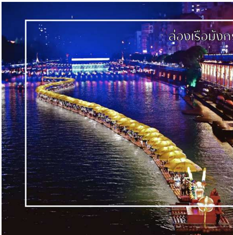
ล่องเรือมังกรแม่น้ำก้งสู่ย

นำท่านสัมผัสประสบการณ์สุดพิเศษ ล่องเรือมังกรแม่น้ำก้งสู่ย ชมวิวยามค่ำคืน เป็นหนึ่งในแม่น้ำที่มีความงดงามและสำคัญ มีชื่อเสียงจากทิวทัศน์ธรรมชาติที่อุดมสมบูรณ์ ริมฝั่งเต็มไปด้วยป่าไผ่ ป่าเขา และภูเขาหินทรายสลับซับซ้อน สายน้ำใสไหลเย็นตัดผ่านหุบเขา สร้างทิวทัศน์ที่งดงามดุจภาพวาด