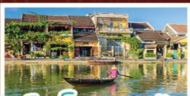
เมืองโบราณเฮอจอัน

! พักบนเขาน่าฮิลล์ 1 คืน ! สัมผัสอากาศเย็นตลอดปี สตรีตฟรังเศสสุดคลาสสิก - นั่งกระเช้ายาวที่สุด สู่นานาฮิลล์ สนุกสุดมันส์ไปกับสวนสนุก The Fantasy Park นมัสการเจ้าแม่กวนอิมองค์ใหญ่ที่สุดของเมืองดานัง - เช็กอินเมืองมรดกโลกฮอยอัน - สนุกสนานไปกับกิจกรรม!!นั่งเรือกระดิง หมู่บ้านกัมทาน เช็กอินร้านกาแฟ SON TRA MARINA CAFE - ไม่หลงร้านช้อปปิ้ง - อิ่มอร่อยกับบุฟเฟ่ต์นานาชาติ , หม้อไฟซีฟู้ด