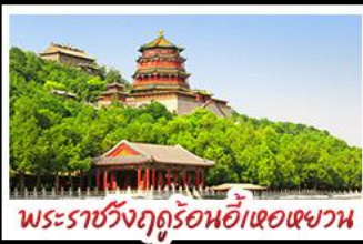
พระราชวังฤดูร้อนอี๋เหอหยวน

บ๊อพิเศษ เปิดปักกิ่ง สุกี่มองโก MICHELIN GUIDE ร้าน TAO TAO JU