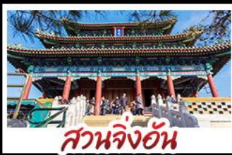
สวนจิ้งอัน