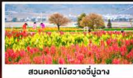
สวนดอกไม้ฮวงอวี่มู่ฉาง