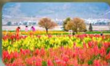
สวนดอกไม้ฮวาอวี๋มู่ฉาง