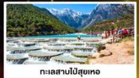
ทะเลสาบไป๋สุยเหอ