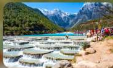
ทะเลสาบไป๋สุยเหอ