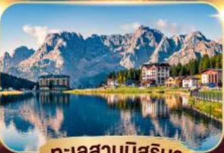
ทะเลสาบมิสุรีนา