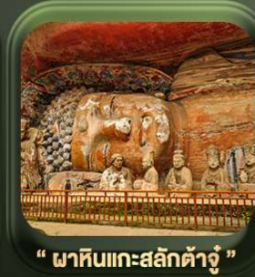
“ พาทินแกะสลักต้าจู้ ”