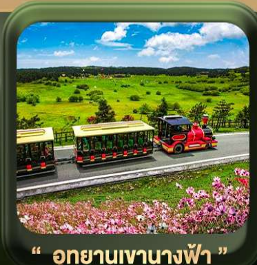
“ อุทยานเขานางฟ้า ”

T2G-CKG26CZ Special of Chongqing...จงซิง ต้าจู้ อุ้หลง อุทยานหลุมฟ้า เขานางฟ้า 5D 3N (CZ)