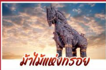
ม้าไม้แห่งกรอย