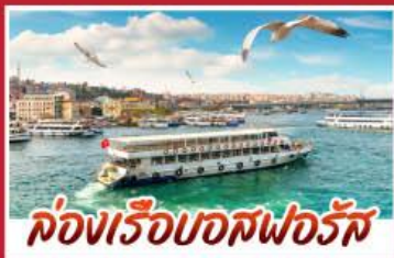
ล่องเรือบอสฟอรัส