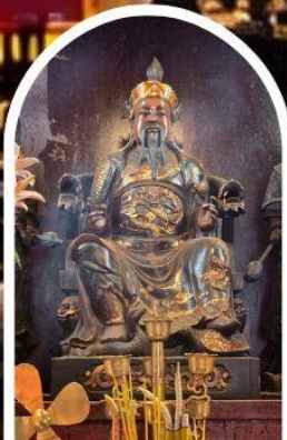
วัดปักไต้ เสริมโชคกลางนำความรุ่งเรืองทุกด้านของชีวิต