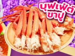
บุฟเฟ่ต์ ซาซึ