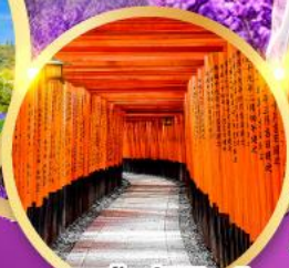
ศาลเจ้าฟุชิมิอินาริ