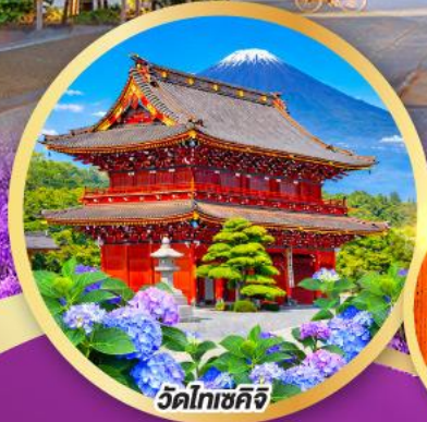
วัดโทเซคิจิ