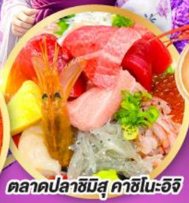
ตลาดปลาชิบิสึ คาชิโนะอิชิ