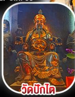
วัดบิกิต