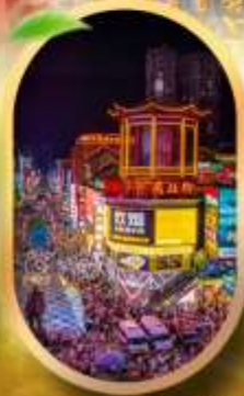
ถนนคนเดินซิงลู่