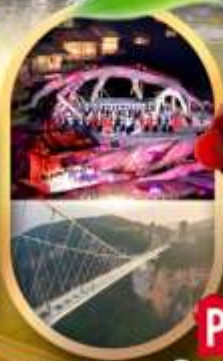
OPTION 1: ไร่ฉางผางจิ้งจอกขาว OPTION 2: สะพานแก้วจางเจียเจีย