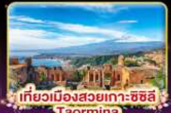
เที่ยวเมืองสวยเกาะซซิลี Taormina