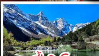
ปี่ผิงโกว