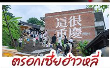
ตรอกเซี่ยงฮ่าวหลี่