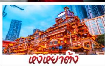
เจงเฉาตัง