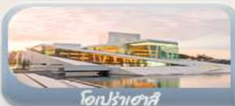
โอปราเฮาส์

สักครั้งในชีวิตกับการนั่งรถไฟสายโรแมนติกฟลัมสบาน่า สองเรือชมฟยอร์ด ขึ้นกระเช้าลอยฟ้าพิชิตยอดเขาอูสริเคน เบอร์เกน นั่งรถรางสวยอดเขาฟลอมอนชมวิวเมือง ออสโล เยี่ยมชมโอปราเฮาส์ มหาวิหารออสโล ป้อมปราการอาครส์ฮูส สวนอนุสรณ์ชาติ Vigeland Sculpture Park