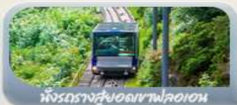
นั่งรถรางสวยอดเขาฟลอมอน