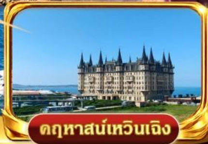
คฤหาสน์เทวินเจ็จ