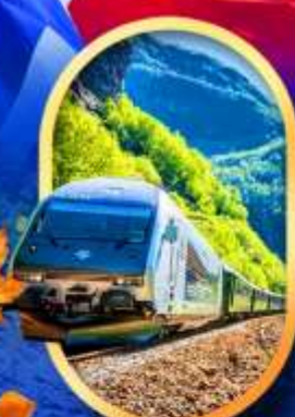
รถไฟฟลิมสขาน่า