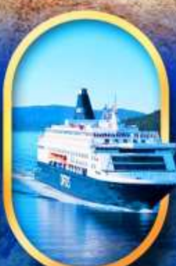
นั้งเรือ DFDS