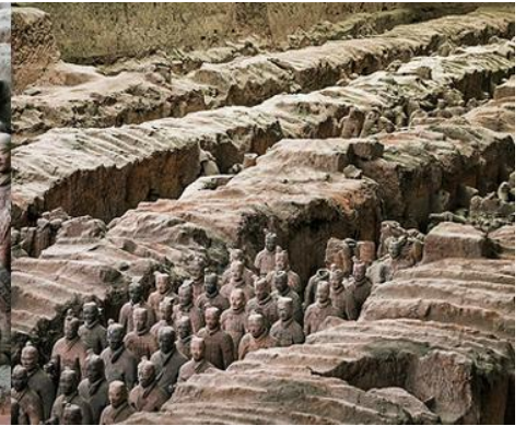
สุสานกองทัพทหารม้าจีนซี