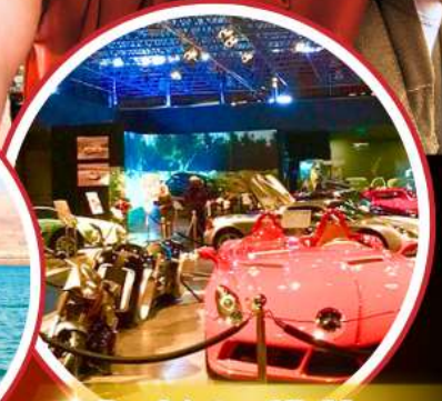
Royal Automobile Museum