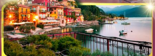
ทะเลสาบโลโบ