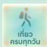
เที่ยว ครบทุกวัน