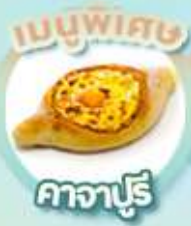
คาจาปูรี