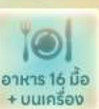
อาหาร 16 มื้อ + บนเครื่อง