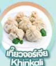
เกี้ยวจอร์เจีย Khinkali