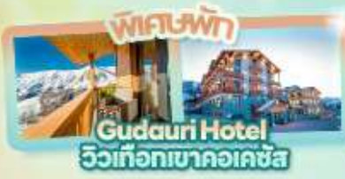
ที่พัก Gudauri Hotel วิวเทือกเขาคอเคซัส

Tbilisi Gudauri Borjomi Kazbegi Uplistsikhe