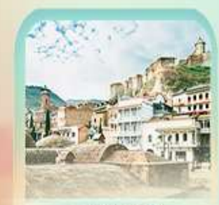
อะบาห์ตุบาห์