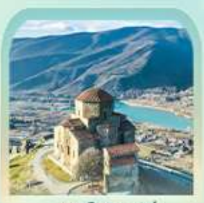
มทวิซาร์จวารี