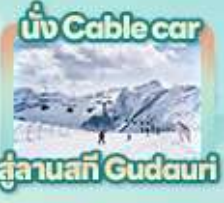
นั่ง Cable car สู่ลานสกี Gudauri