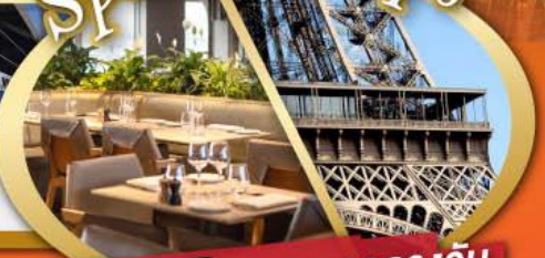
รับประทานอาหารกลางวัน บนหอคอยเฟลา

ไฮไลท์ในโปรแกรม • สะพานไมชาเปเล ลูเซิร์น