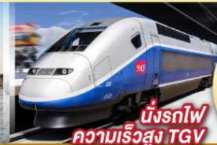
นั่งรถไฟ ความเร็วสูง TGV