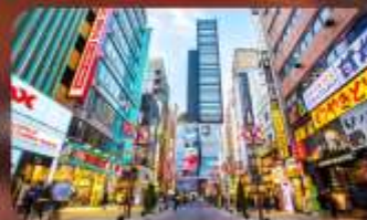
ซ้อปิ้งชินจูกุ