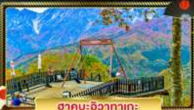
อากาศ: อากาศ: