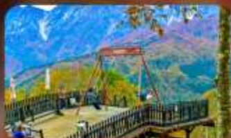
ฮาคุบะอิวากาเกะ