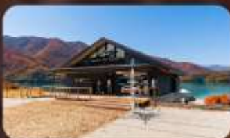
AO Lakeside Cafe'