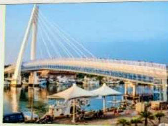
สะพานคู่รักตั้นส่วย