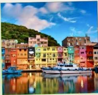
ท่าเรือเจิ้งปิง