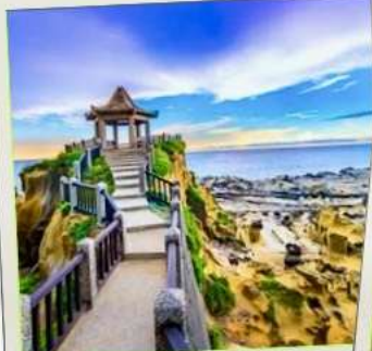
อุทยานเกาะเหอผิง