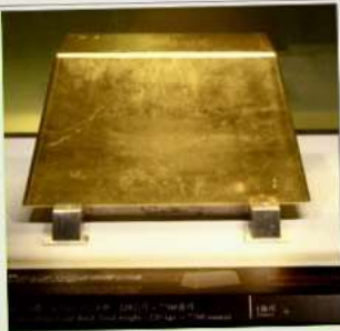
พิพิธภัณฑ์ทองคำ