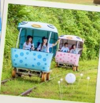
Shen'ao Rail Bike