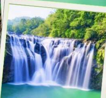
น้ำตกซือเฟิ่น