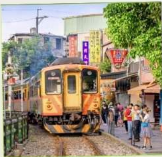
สถานีรถไฟซือเฟิ่น