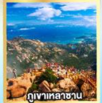
กุหาเหลาซาน