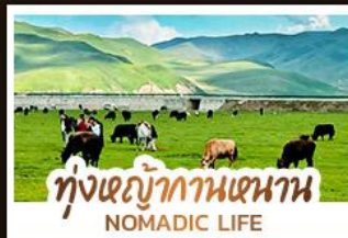
ทุ่งหญ้ากานหนาน NOMADIC LIFE