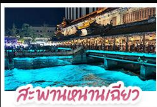
สะพานเซทานาเมียว