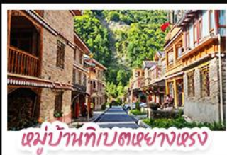
เดมู่บ้านทิเบตเซียงแรง

ตะลุยเจิงคู คูหิมะต้ากุกึงชวน ชวนเช็กอินแพนด้ายักษ์ พักใจที่หยดน้ำดาสีฟ้า! แวะชิลเมืองโบราณลั่วได๋ สัมผัสบนเต๊นท์ที่ หมู่บ้านทิเบตทางทรงฮาต้อ สัมผัสความหนาวเย็นที่ อุกยานสวรรค์ธารน้ำแข็งต้ากุกึงชวน แหล่งรวมวิวหลักล้าน ตื่นตาไปกับแสงสียามค่ำคั่น หยดน้ำดาสีฟ้า ณ สะพานทานาเมียว เมืองตุงเจียงเยี่ยน ก่อนปิดท้ายด้วยการช้อปปิ้งจุใจ ถนนช้อปปิ้ง-ไถ่กุหล่ำ และอะภาทักกับ แพนด้าเซลฟี่ สุดคิว!