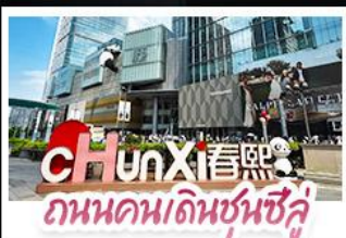
ถนนคนเดินชุนฮี้