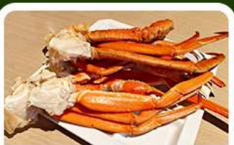
เมนูพิเศษ! ซาซิมิ

เกาะเอโนะชิมะ วิวสวยงามติด 1 ใน 100 ภูมิทัศน์ญี่ปุ่น พร้อมขอพรศาลเจ้าศักดิ์สิทธิ์ เที่ยวเต็มทั้ง 3 วัน แบบจุใจ ทั้งวัด ศาลเจ้า สวนดอกไม้ และช้อปปิ้ง