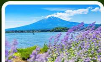
สวนโอบิชิ ปาร์ค